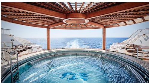
海上日式浴場「泉之湯」 IZUMI

**以上船票價目是以 2019 年 9 月 4 日之報價計算, 所有價目會因應供應量而作出調整, 報名前請先向本公司職員查詢即時報價。