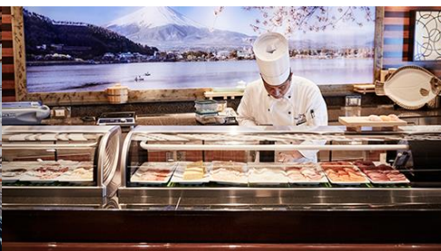
海壽司餐廳 Kai Sushi